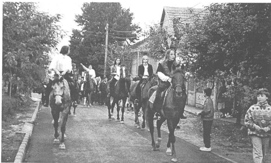
Lovasok „meózzák” az Akácfa utcát a szüreti felvonuláson