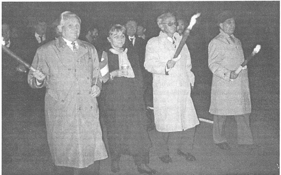
A képviselő-testület tagjai a fáklásmenet élén

Ezt követően a vörösvári intézmények, egyesületek, kisebbségi önkormányzatok, valamint az MSZP és az SZDSZ helyi szervezeteinek képviselői koszorút helyeztek el a hősök emlékművénel. Az ünnepség hét óra tájban a Szózáttal ért véget.