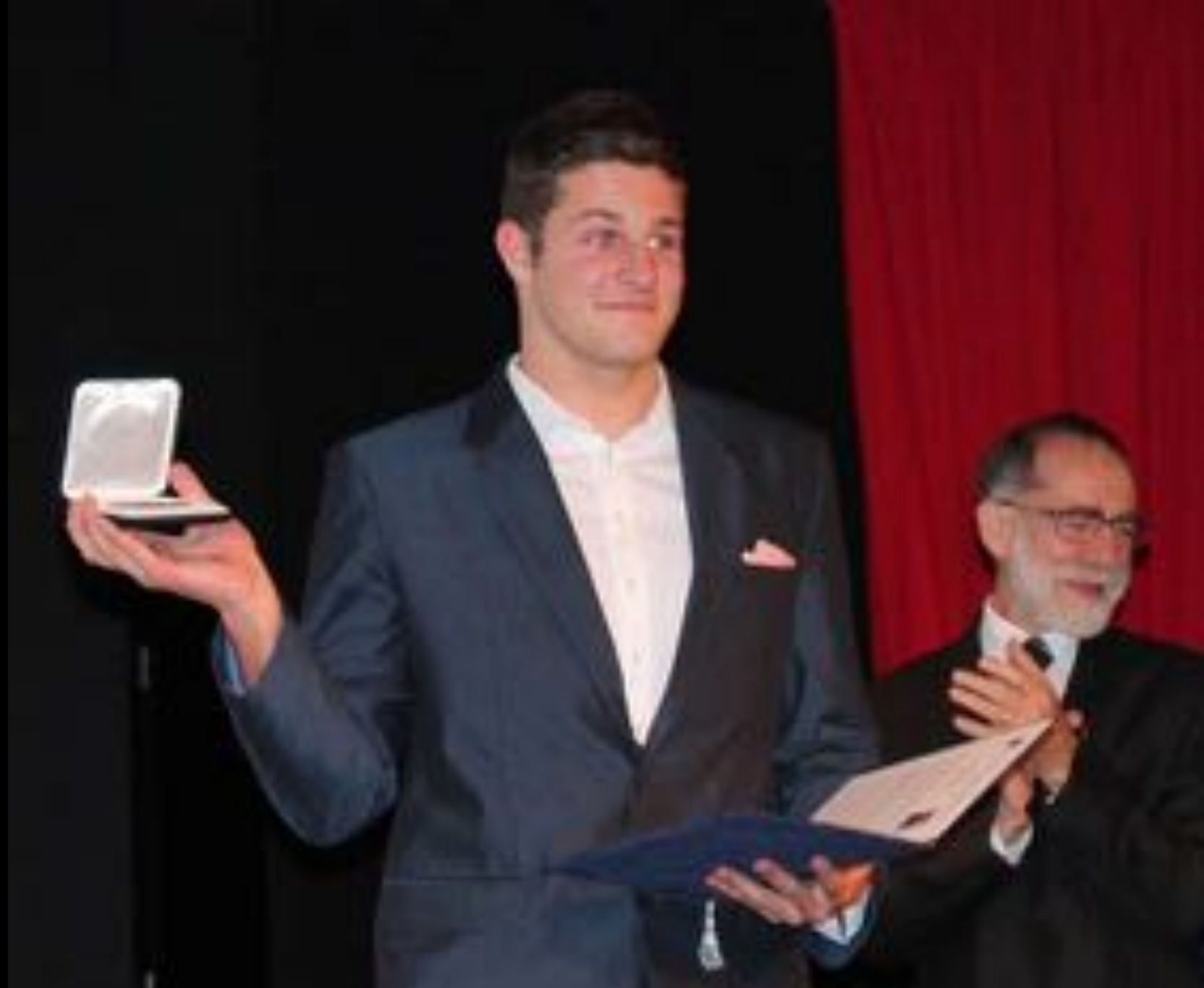
2016.10.23. Pilisvörösvárért emlékérem Manhercz Krisztián vízilabdázónak