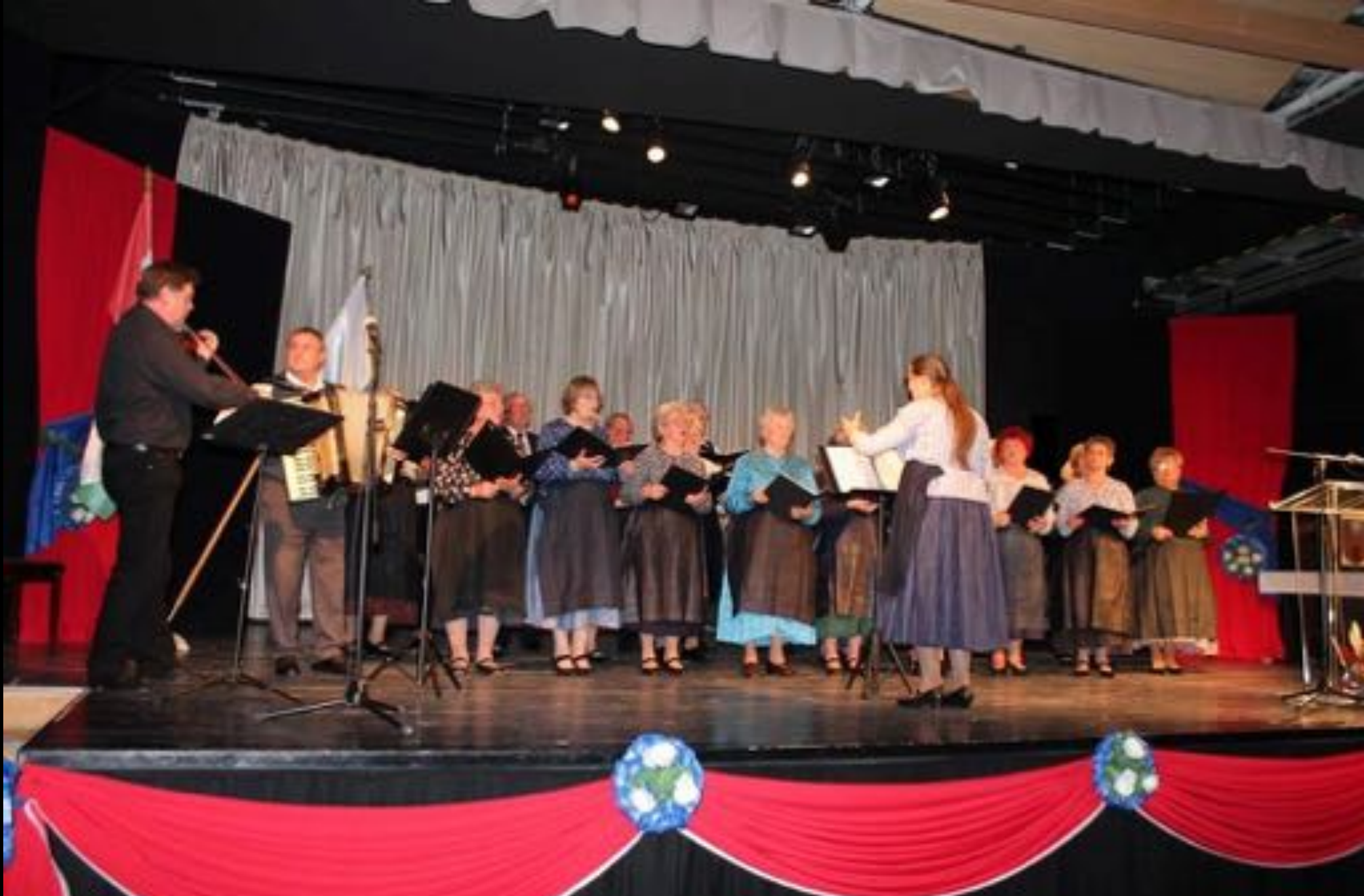
2016.10.23. Pilisvörösvárért emlékérem a Nostalgia Dalkörnek