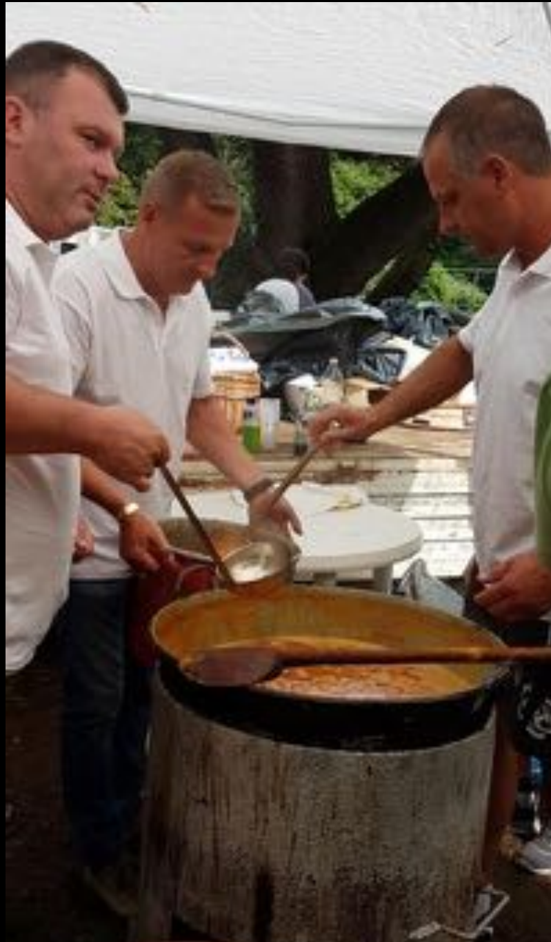
2017.08.20. VÖRÖSVÁRI NAPOK - Halászléfőző verseny