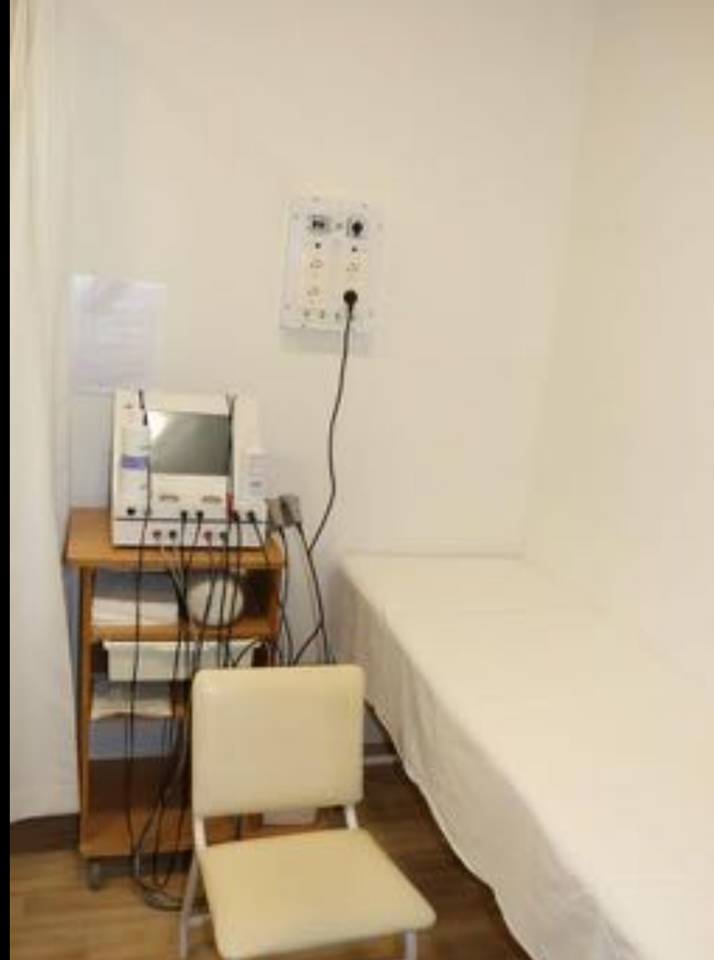
2017.03.09. Az új fizioterápiás rendelő felavatása