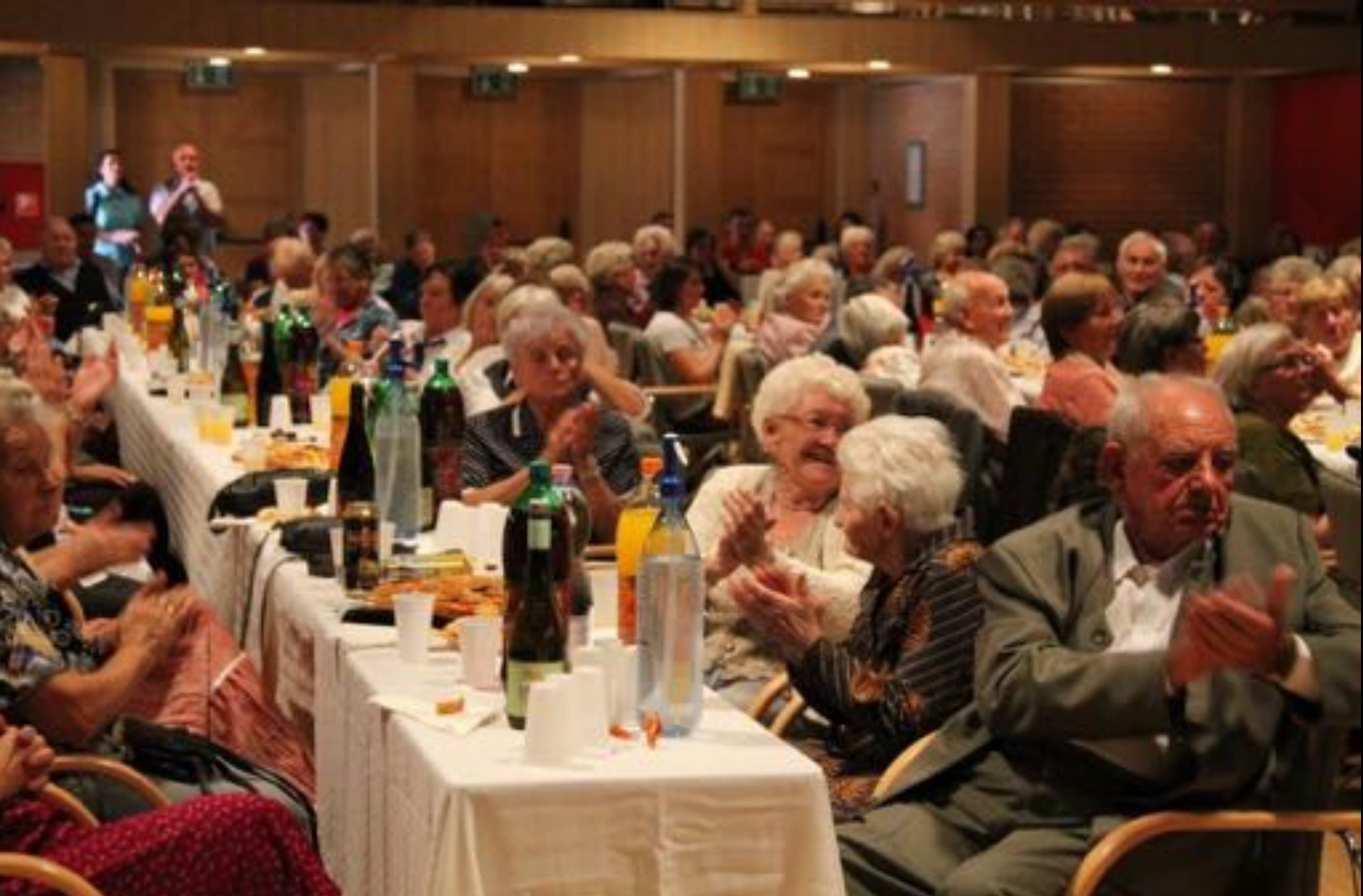
2016.10.01. Idősek világnapja