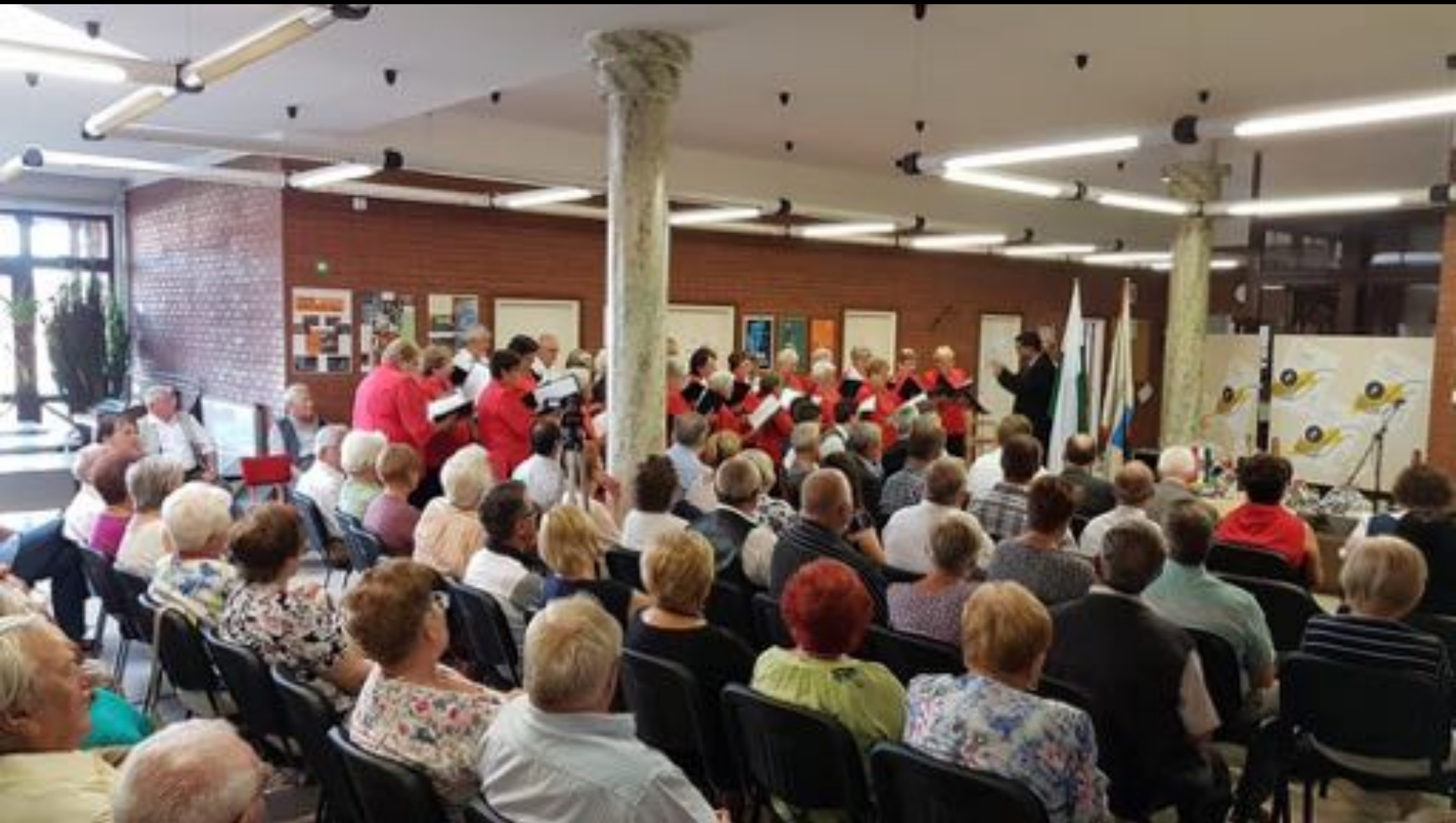
2017.08.15. A gröbenzeli testvérvárosi kapcsolat 25. évfordulójának megünneplése