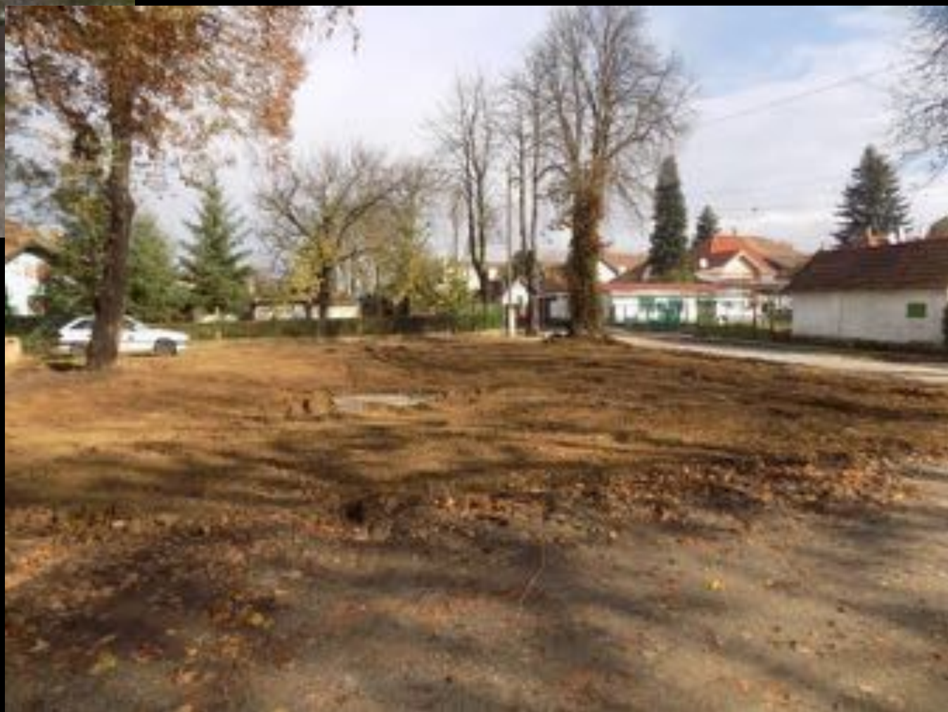
2016.11.04. Muskátli köz 1. szám alatti épület bontása 1 841 500 Ft