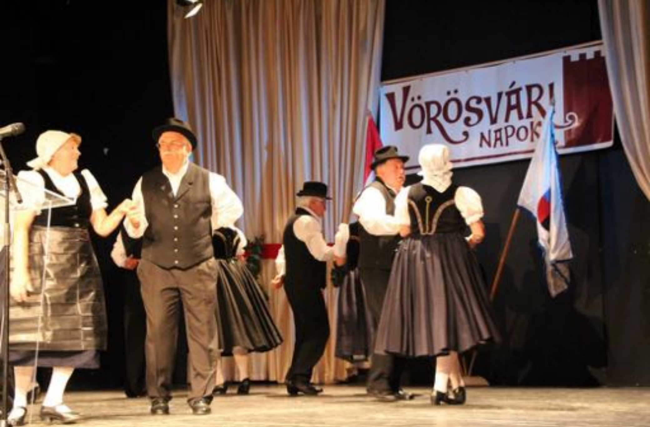
2017.08.11-14. és 19-20. Vörösvári Napok