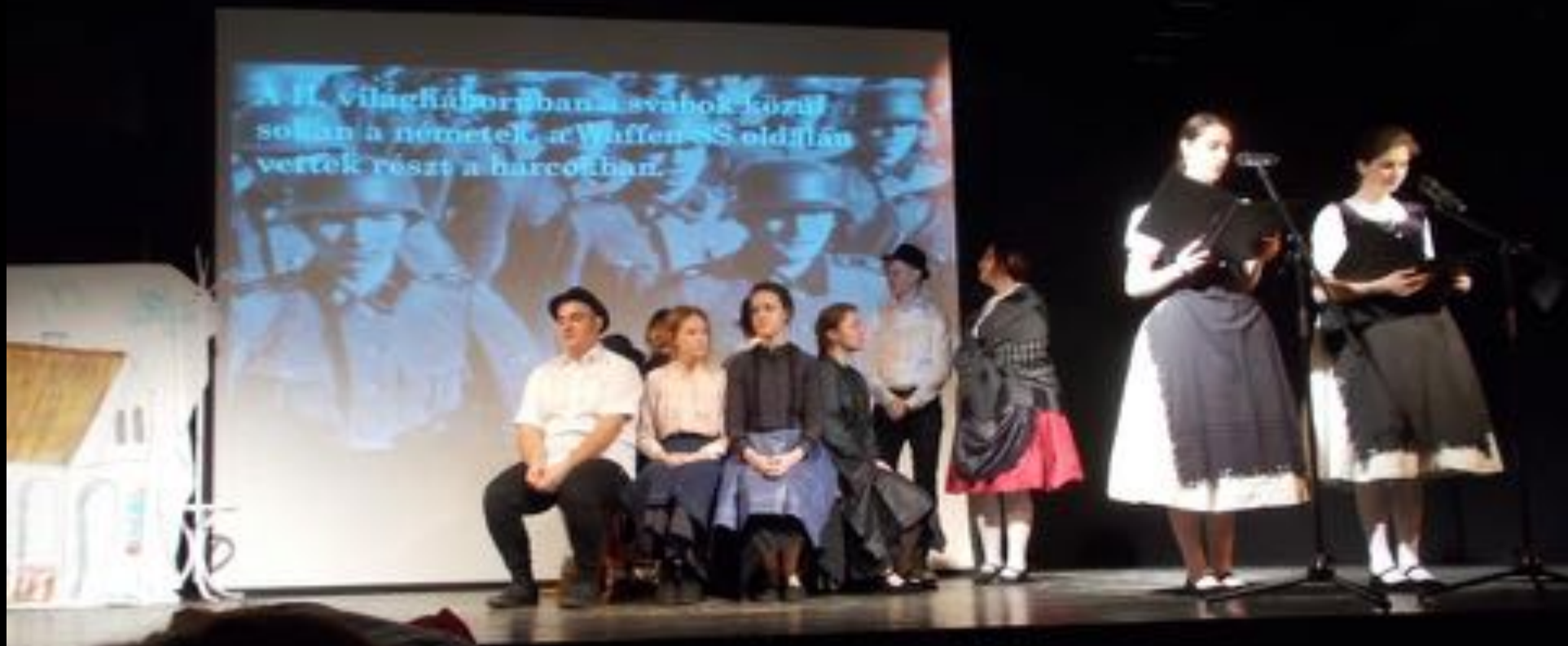
2017.01.19. A magyarországi németek elhurcolásának és elűzetésének emléknapja