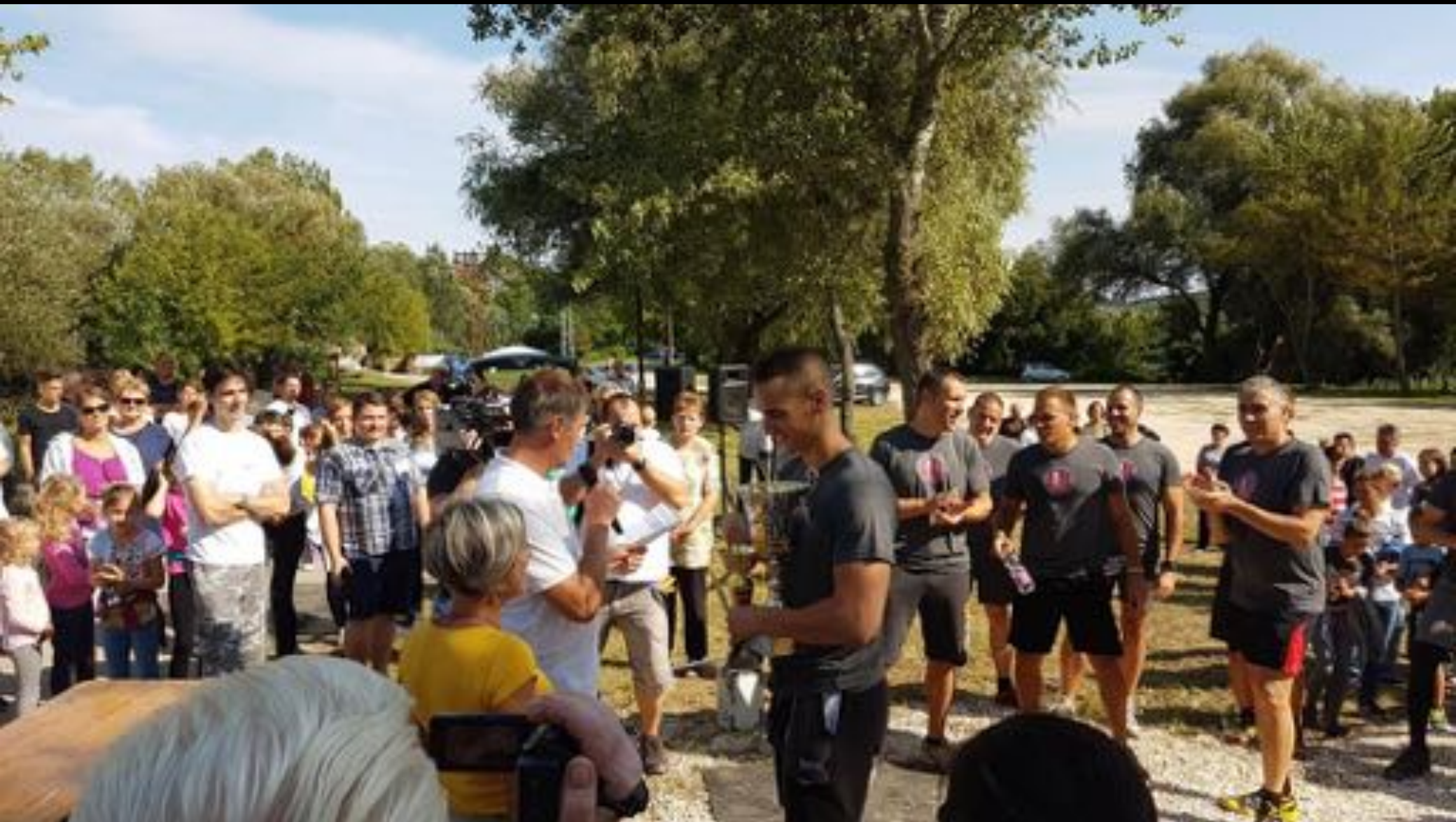
2017.08.20. VÖRÖSVÁRI NAPOK - Tutajhúzó verseny