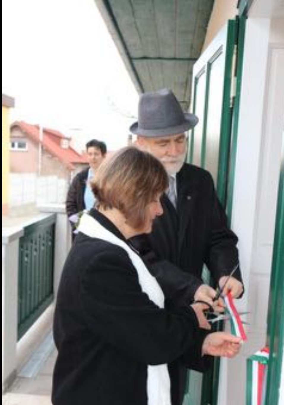
2017.03.09. Az új fizioterápiás rendelő felavatása