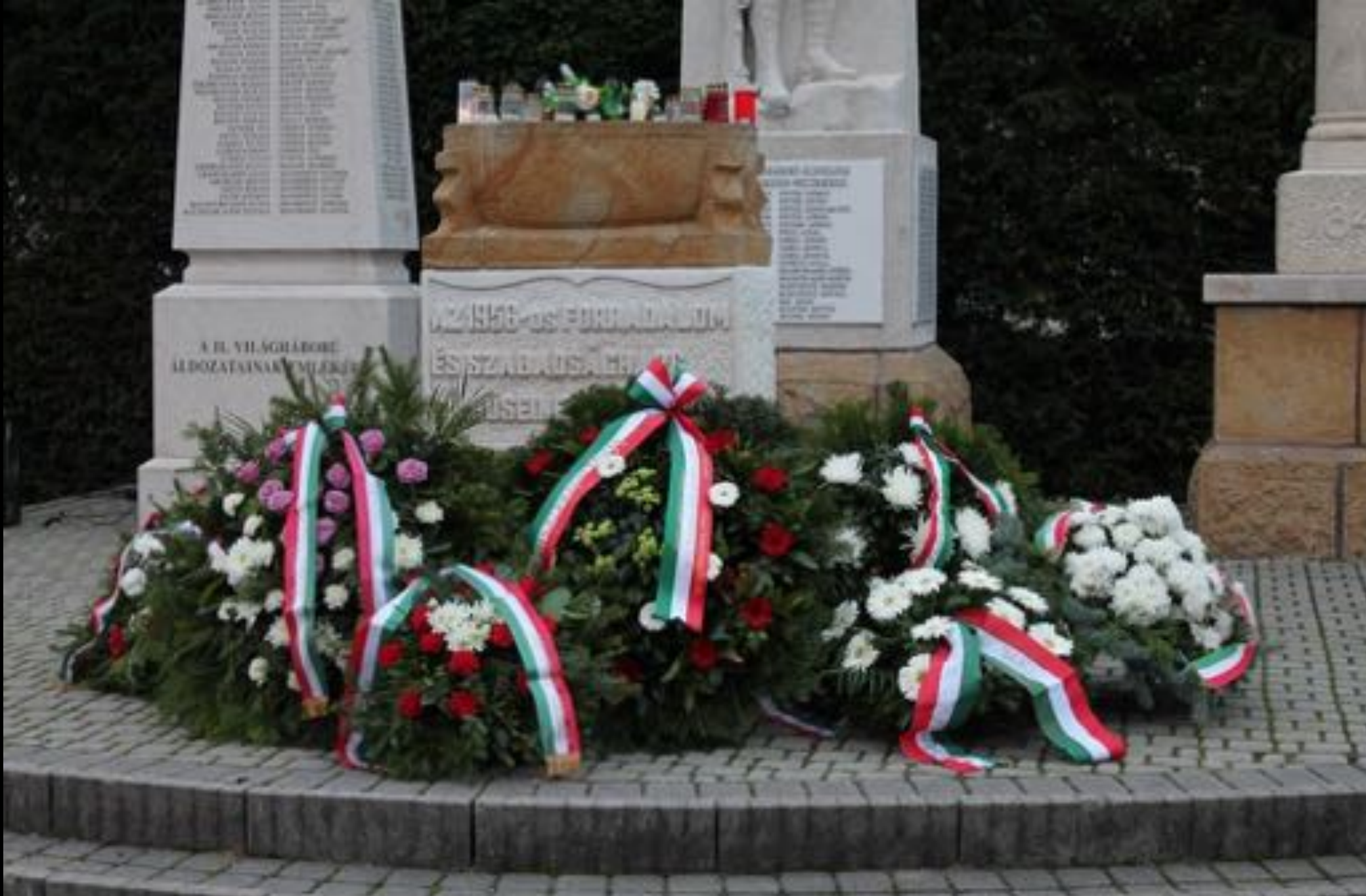
2016.10.23. Az 1956. évi forradalom és szabadságharc emléknepja