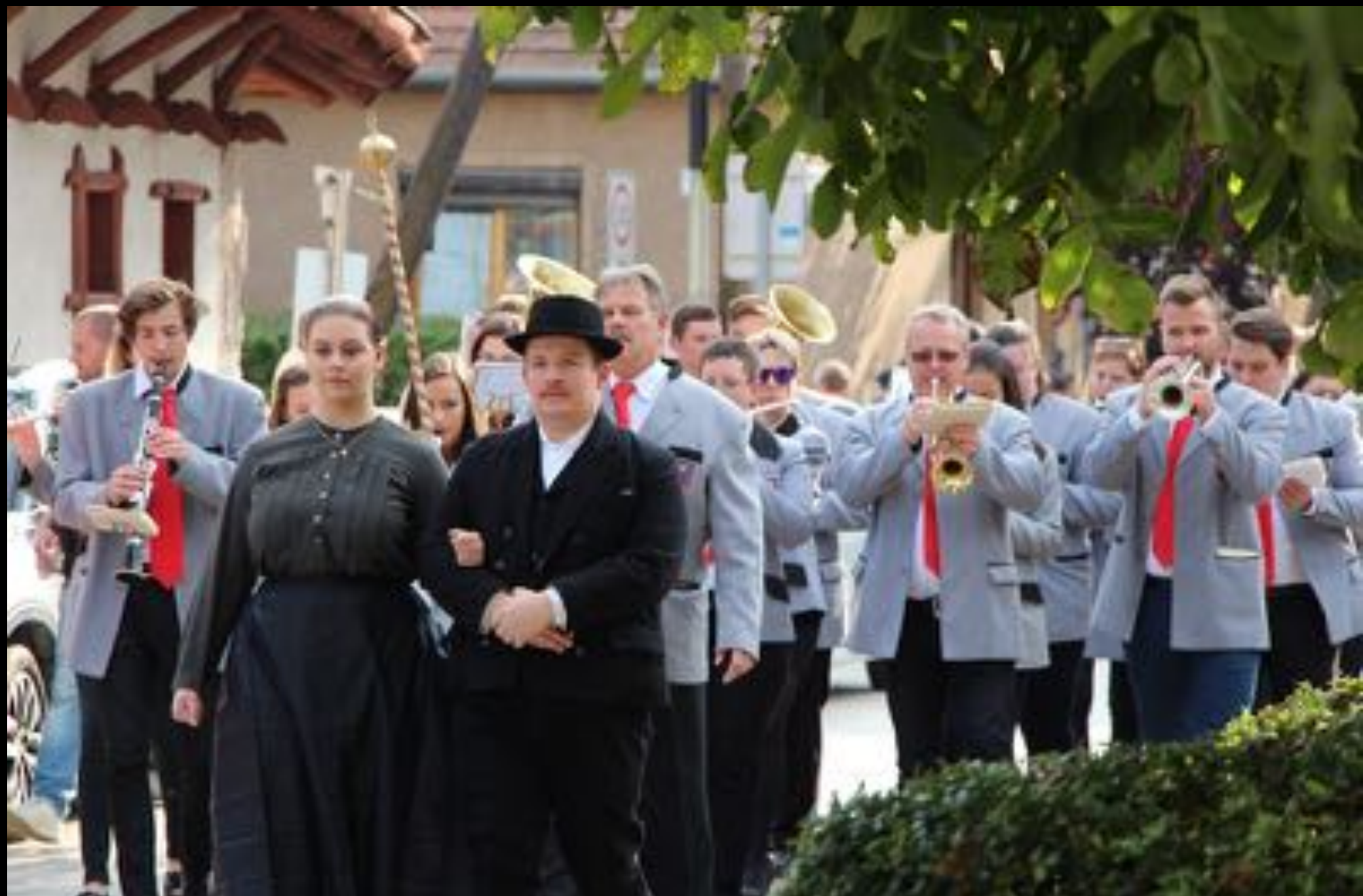
2017.09.30. Szüreti felvonulás