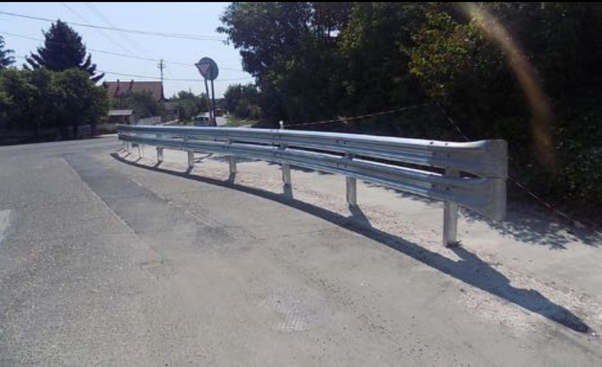
2017.09.15. Járdáépítés védőkorláttal a Nyár utca - Kisfaludy utca kereszteződésében 1 066 673 Ft