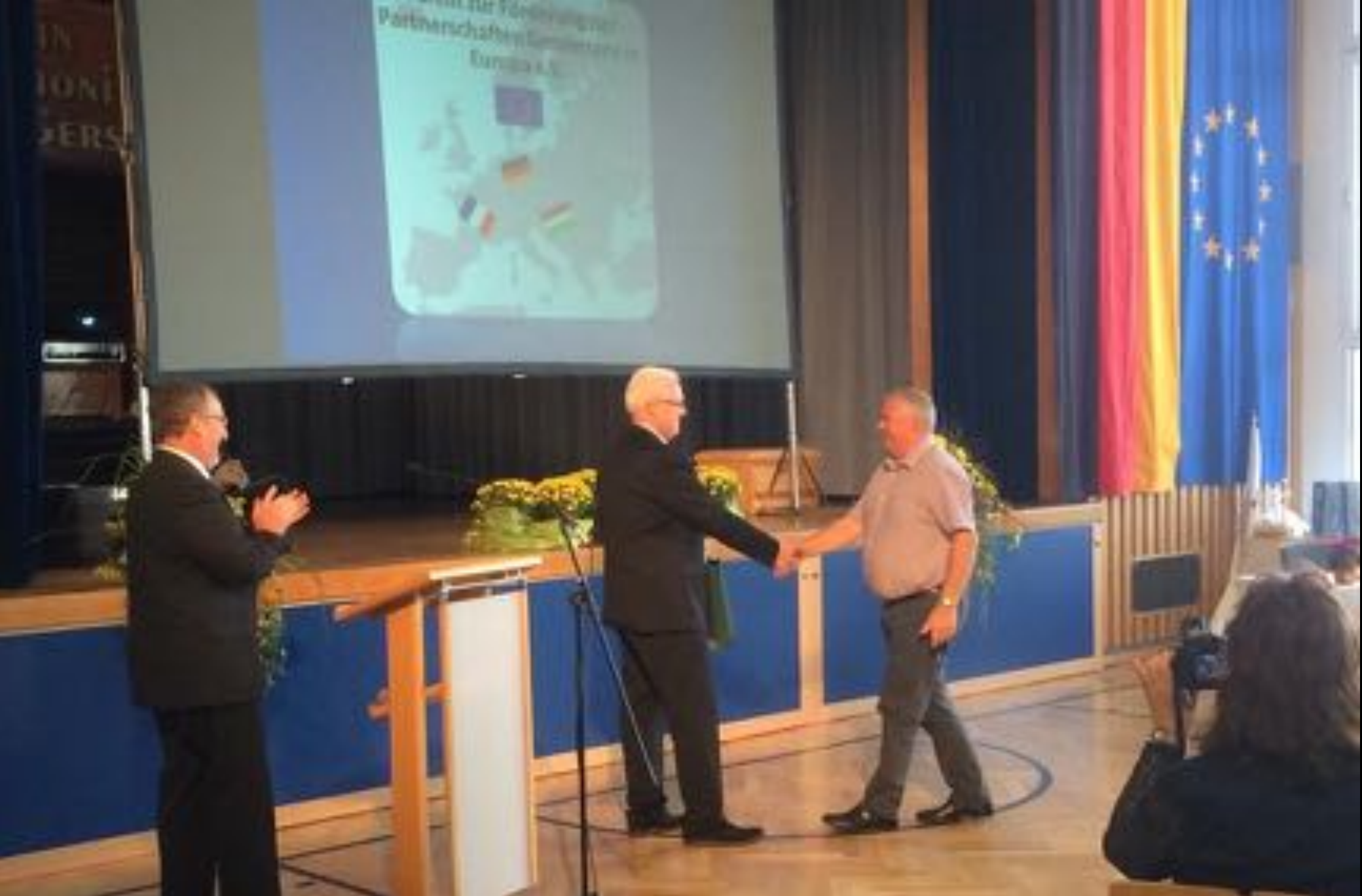
2016.10.04. Gerstetten és Pilisvörösvár testvérvárosi kapcsolatának 20 éves jubileuma