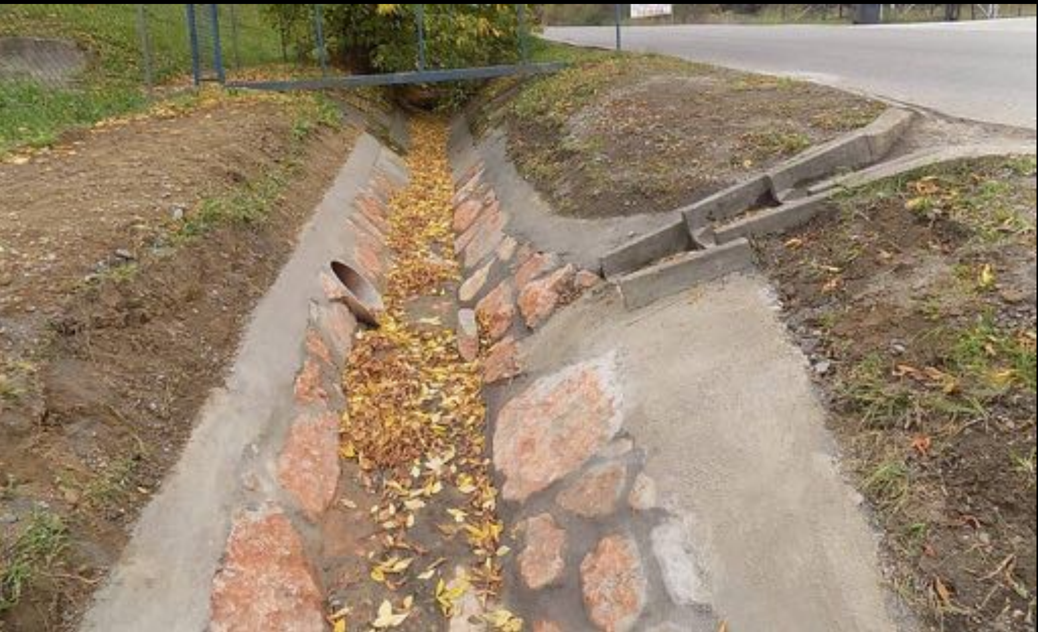
2017.10.10. Csapadékvíz-elvezető árok helyreállítása (Szent László utca) 2 476 378