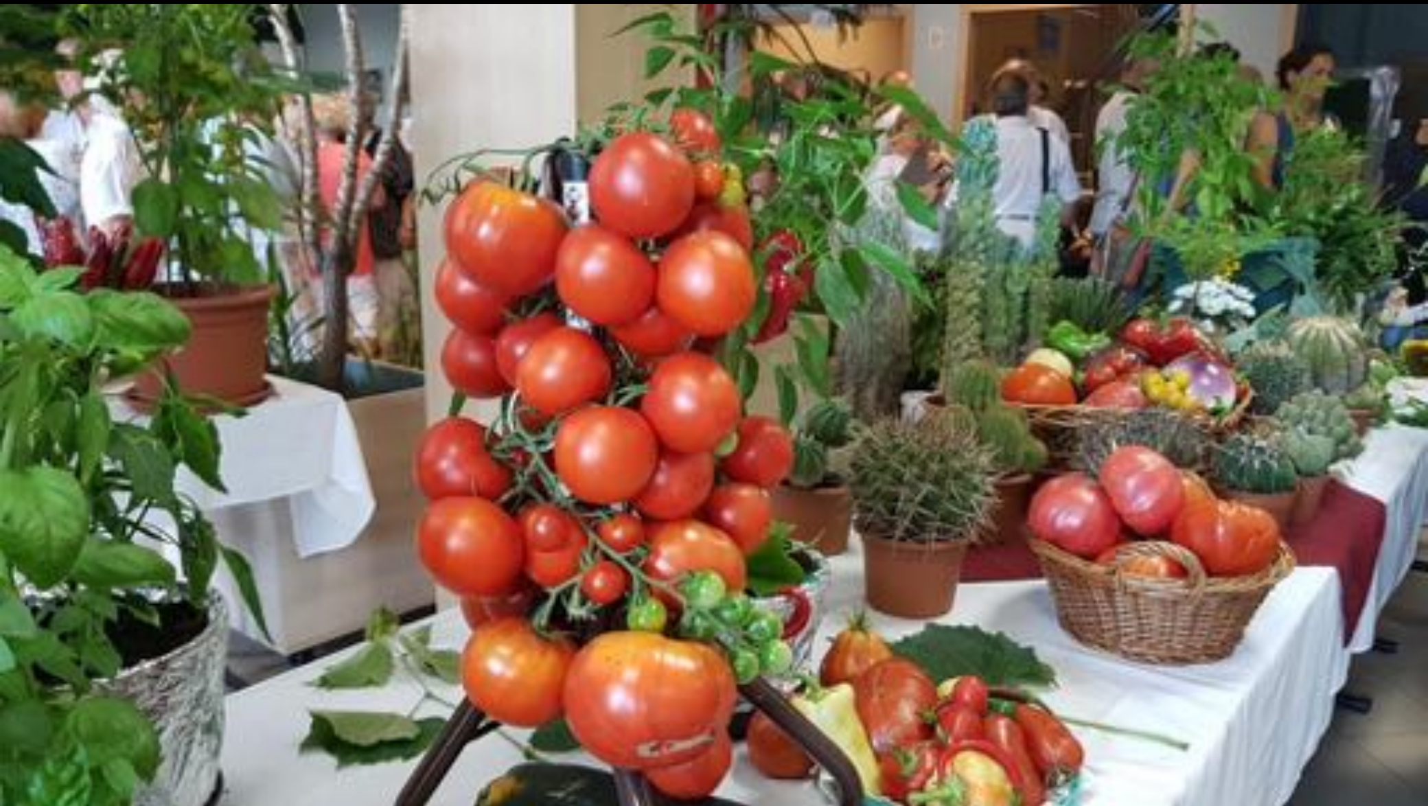
2017.08.11. VÖRÖSVÁRI NAPOK - A Kertbarát Kör terménybemutatója