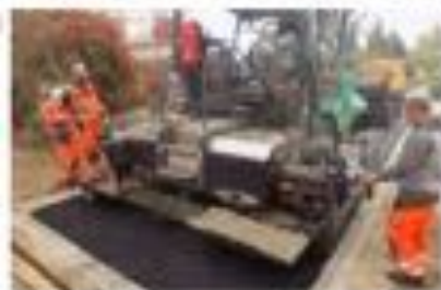
Aszfaltozás a Kálvária utcában