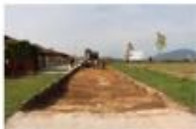
Megkezdődtek a Báthory utcai földmunkák

Már kondicionálást is adtunk az iskolásoknak.