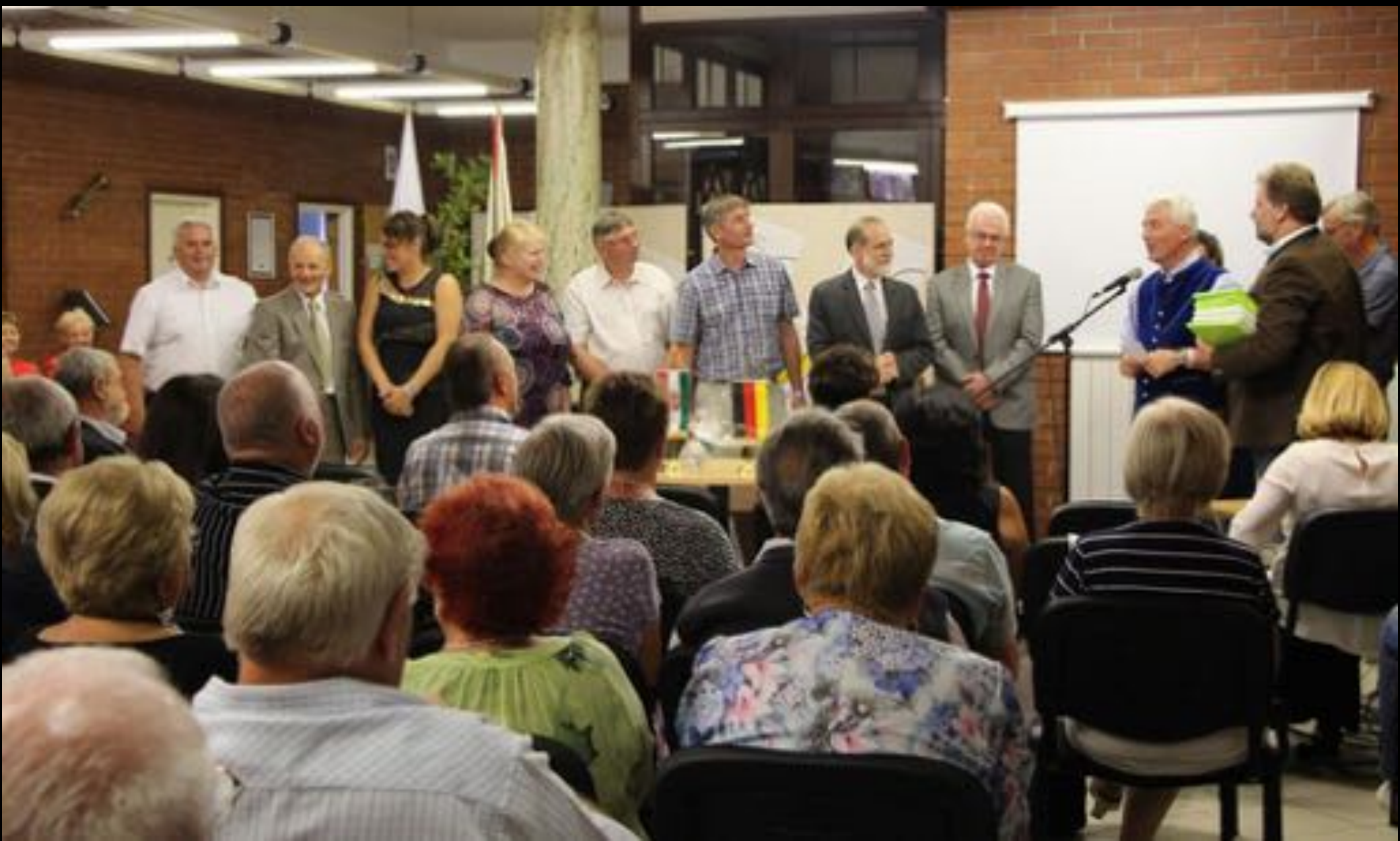
2017.08.15. A gröbenzelli testvérvárosi kapcsolat 25. évfordulójának megünneplése