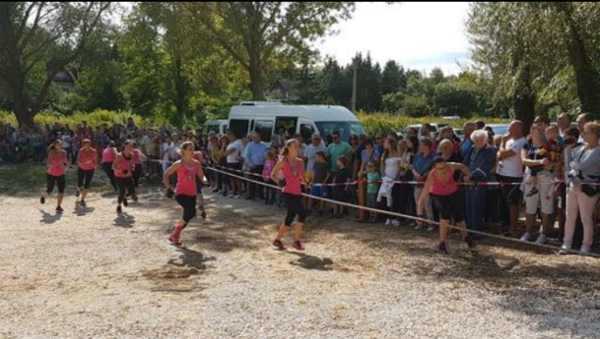
2017.08.20. VÖRÖSVÁRI NAPOK - Tutajhúzó verseny