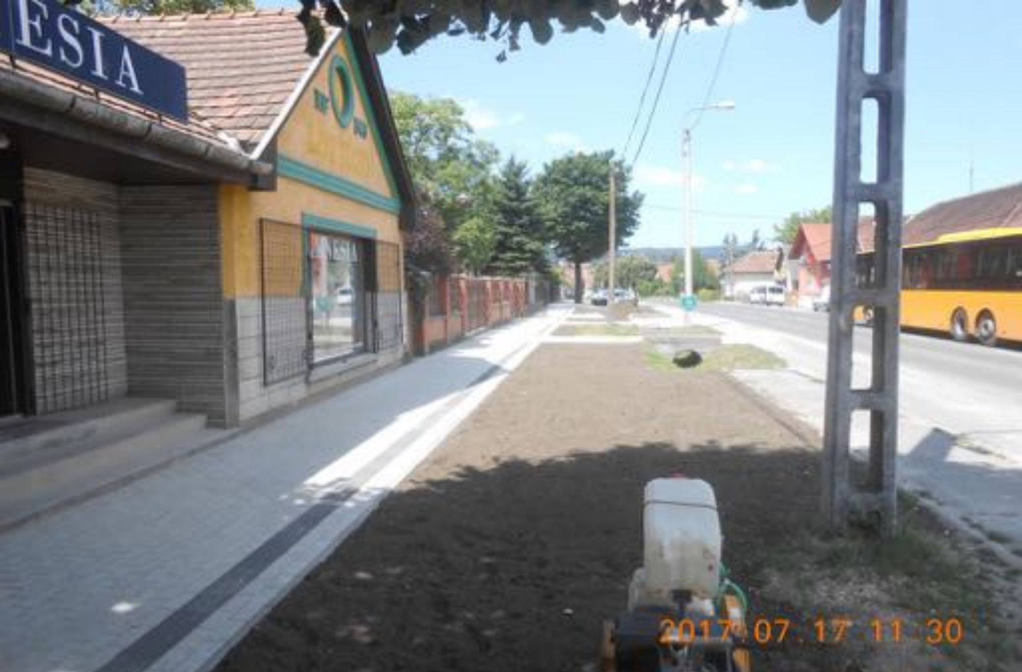
2017.09.15. Járdáépítés a Fő utca Gesztenye u.- Ady Endre u. közötti szakaszán 13 061 950 Ft