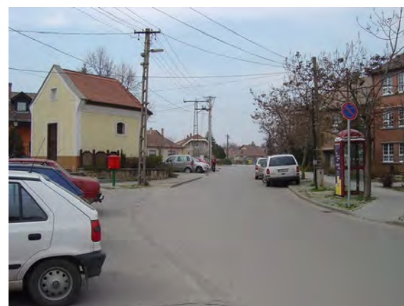
Műemlékként nyilvántartott Mária kápolna parkolók között, méltatlan környezetben.