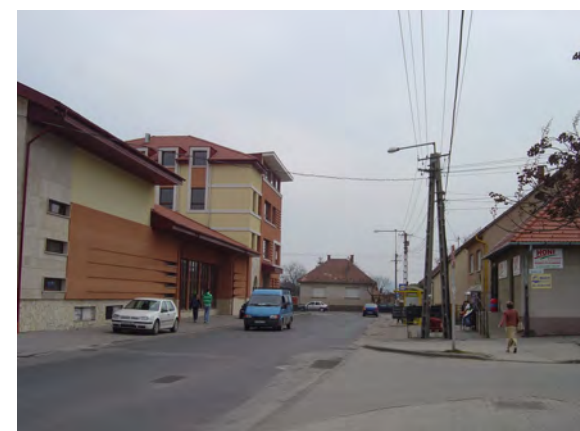
Szabadság utca torkolata a Művészetek háza előtt.

Megjegyzés: A tervlap egy javaslat a személygépkocsis közlekedés és parkolás, a gyalogos közlekedés, és a zöldfelületek rendszerére. Nem terjed ki annak teljeskörű műszaki megoldására. (Pl.: teljeskörű fásítás, zöldfelületen belüli gyalogutak, úttest-lekerekítések stb.)