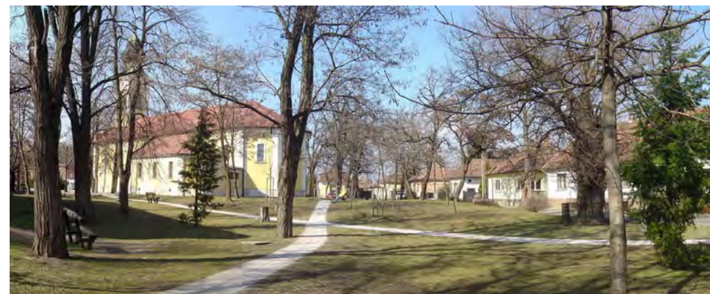
A templom körüli funkció nélküli összefüggő zöldfelület