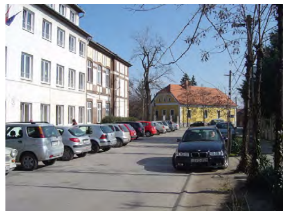
Általános iskola előtti parkoló az Iskola utcában