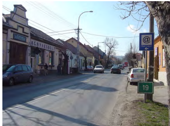
Helyi védelem alatt álló könyvtárépület a Fő u. 82. szám alatt.