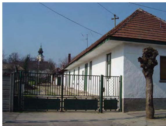
Szép parasztháza a Puskin u. 7. szám alatt.