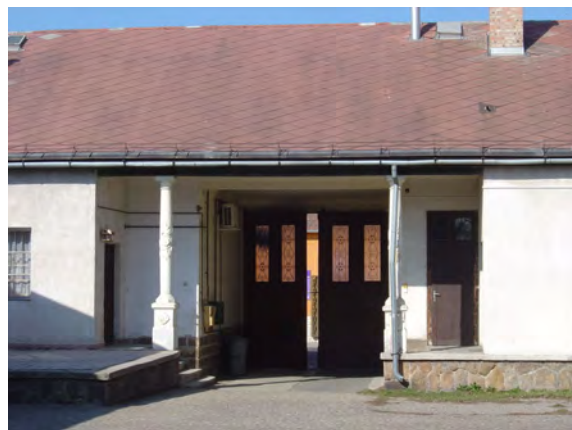
Könyvtár épület áthajtója.